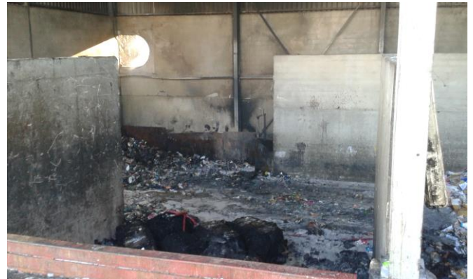
Vue intérieure du centre de tri après l'incendie

Le Symctom réalise actuellement des études technico-économiques concernant l'avenir du site avec soit la reconstruction d'une chaîne de tri pour les emballages ménagers, soit la mise en place d'une activité nouvelle, toujours dans le domaine des déchets, qui reste à définir en fonction de son intérêt social, économique et écologique.